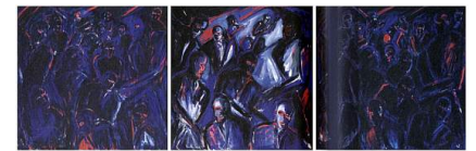
Abb. (2) Helmut Middendorf, Großstadteingeborene, 1980.